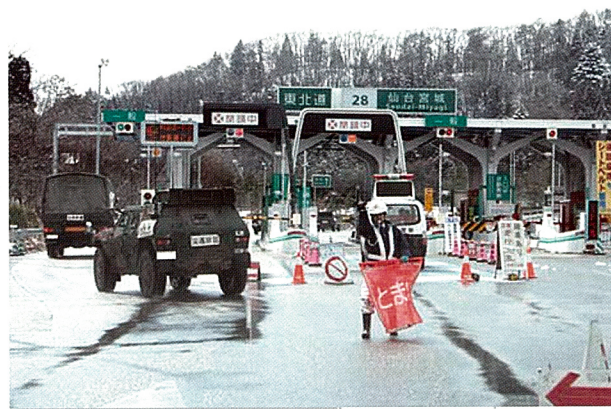
自衛隊車両の通行 (東北道 仙台宮城 | C)

横環が整備されると、地震などの災害時には、東名高速道路や横浜横須賀道路などと一体となって、緊急輸送路としての役割が期待されます。