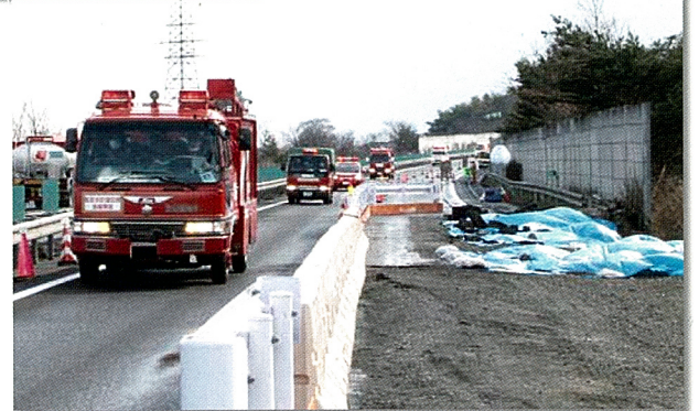
応急復旧の現場を通行する緊急車両 (東北道 福島飯坂 | C～国見 | C)